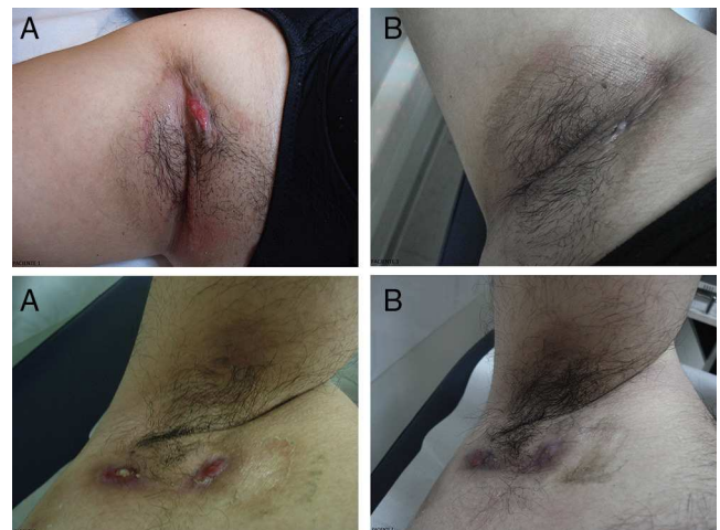
Figura 1 Pacientes con compromiso axilar por HAS. Se muestran los resultados de 2 pacientes de la tabla 1 con compromiso bilateral de axilas por HAS. A. Fotografías de los pacientes pre-tratamiento. B. A las 8 semanas de seguimiento. En el paciente 1 se observa respuesta satisfactoria al tratamiento. En el paciente 2 se evidencia importante disminución de lesiones inflamatorias y signos de actividad de la enfermedad.

Se les sometió a la aplicación de solución de ALA al 20% (Oldex®, Recalcine) durante 1,5 h, irradiando posteriormente con luz de 635 nm, sistema PDT 1200L Waldman® (Herbert Waldmann GmbH & Co. KG Villingen-Schwenningen, Alemania), a dosis de 37 \text{ J/cm}^2 e intensidad 70 \text{ mW/cm}^2 por sesión. Se realizaron un mínimo de 4 sesiones por paciente, separadas por una o 2 semanas, con control clínico a las 4 y 8 semanas. Antes del tratamiento y en las visitas de control se determinó la puntuación de severidad descrita por Sartorius et al. 18 , el índice de calidad de vida o DLQI 19 y una escala visual analógica (EVA) para dolor y actividad de la enfermedad: 0 = sin síntomas ni actividad; 1 = leve dolor y actividad; 2 = moderado dolor y actividad; 3 = severo dolor y actividad.