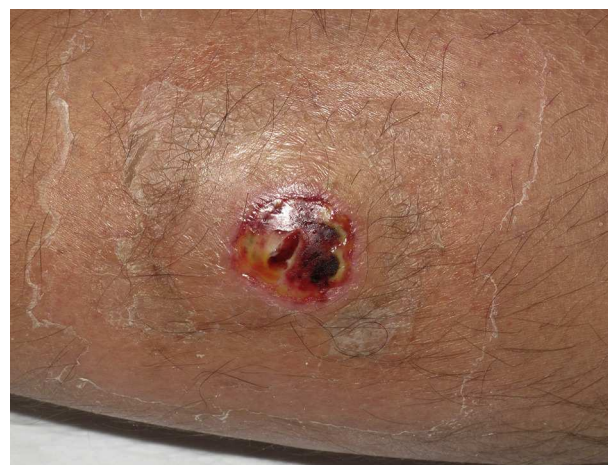
Figura 2 Aspecto característico de los abscesos tras realizar su drenaje: necrosis y ausencia o escasez de exudado purulento.