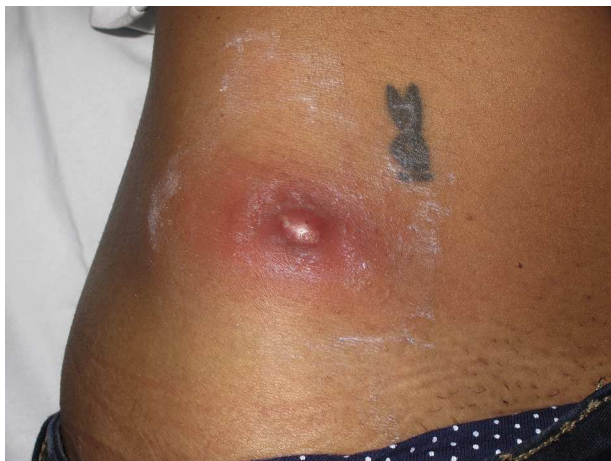
Figura 4 Absceso junto a tatuaje en una mujer joven.

En todos los abscesos se realizó drenaje quirúrgico (8/8) y en el 88% de los mismos se asoció tratamiento antibiótico.