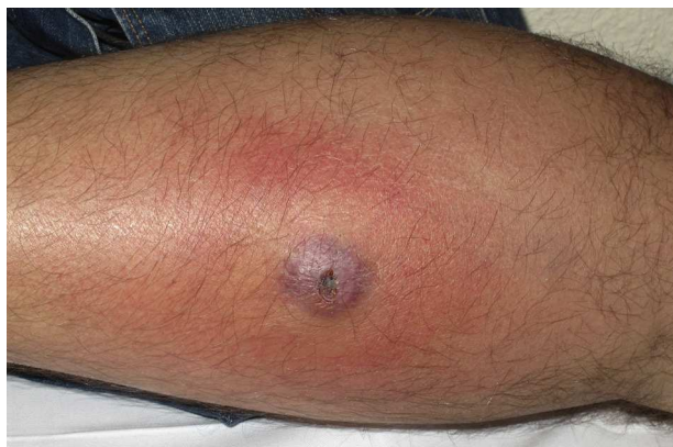
Figura 1 Absceso y celulitis perilesional.

Desde el punto de vista epidemiológico el 36% (4/11) eran españoles, mientras que el 45% (5/11) procedía de países latinoamericanos y el 18% (2/11) de Polonia. Como posibles factores de riesgo implicados en el desarrollo de la infección se identificó la práctica deportiva en 2 pacientes (18%), la danza en 2 (18%) y la realización de procedimientos estéticos no invasivos en uno (9%).