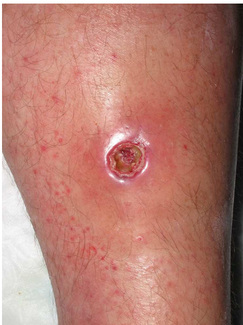
Figura 3 Borde eritematovioláceo y fondo fibrinoso tras el drenaje espontáneo de un absceso en la pierna.

En 2 pacientes se documentaron antecedentes de infecciones cutáneas recurrentes no complicadas.