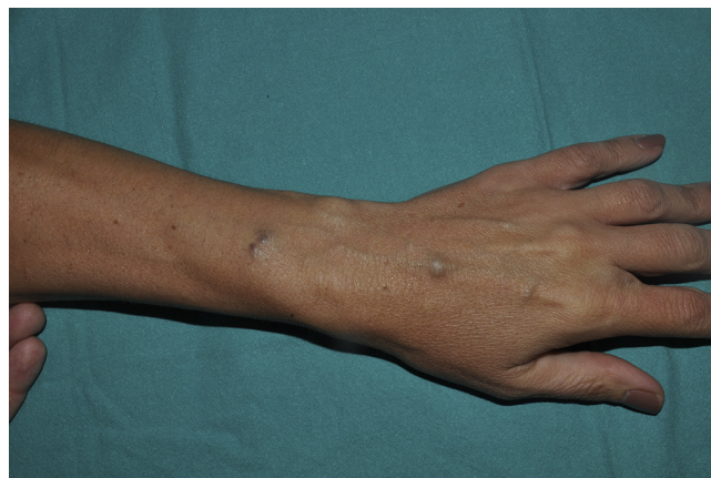
Figura 2 Nódulo azulado en el antebrazo derecho de la madre de la paciente.