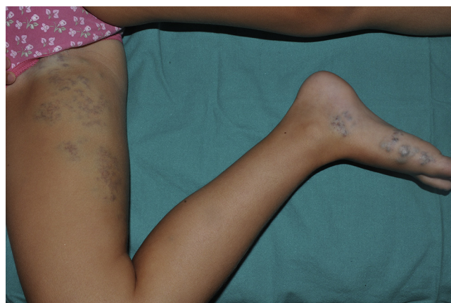
Figura 1 Placa azulada de distribución segmentaria desde la ingle y la cara interna del muslo y la pierna derecha, hasta llegar al pie derecho.

glomovenosa (fig. 3). Teniendo en cuenta el antecedente de placa azulada congénita al nacimiento, la posterior aparición de lesiones dispersas y los antecedentes maternos de cuadro compatible con glomangiomas, realizamos el diagnóstico de mosaicismo tipo 2 en glomangiomas familiar. Por el momento, dada la ausencia de afectación de la