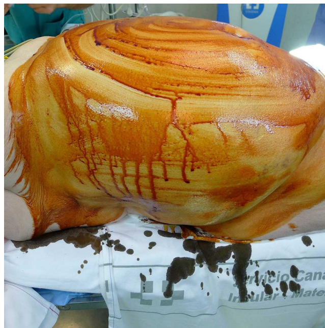
Figura 5 Fotografía cedida por el Servicio de Cirugía General y tomada en el momento anterior a cubrir al paciente con las sábanas quirúrgicas. Nótese el cúmulo de antiséptico en las zonas laterales del tronco.