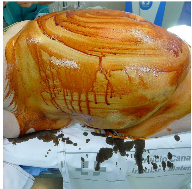
Figura 5 Fotografía cedida por el Servicio de Cirugía General y tomada en el momento anterior a cubrir al paciente con las sábanas quirúrgicas. Nótese el cúmulo de antiséptico en las zonas laterales del tronco.