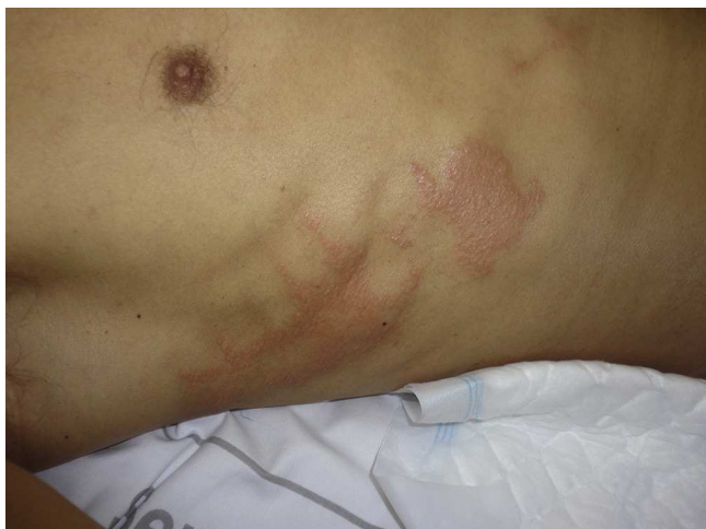
Figura 9 Lesiones irritativas por povidona yodada en el tórax anterior en un paciente intervenido en decúbito prono de artrodesis lumbar.

irritativa por el antiséptico 15 , como las quemaduras por el uso inadecuado del bisturí eléctrico, que se ha comentado anteriormente 4,6 .