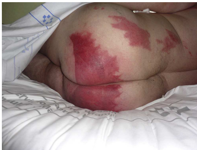
Figura 1 Imágenes en chorreras sugiriendo un líquido como posible causante de la dermatitis.

Otros condicionantes que también pueden influir en la aparición de lesiones son el uso de apósitos de plástico oclusivos (fig. 3), la solución antiséptica utilizada en el campo