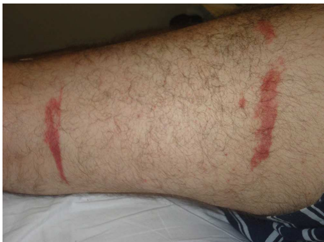
Figura 8 Lesiones en el borde del manguito de hemostasia. Este fue protegido con venda y algodón, que se impregnó de povidona yodada.