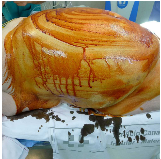
Figura 5 Fotografía cedida por el Servicio de Cirugía General y tomada en el momento anterior a cubrir al paciente con las sábanas quirúrgicas. Nótese el cúmulo de antiséptico en las zonas laterales del tronco.