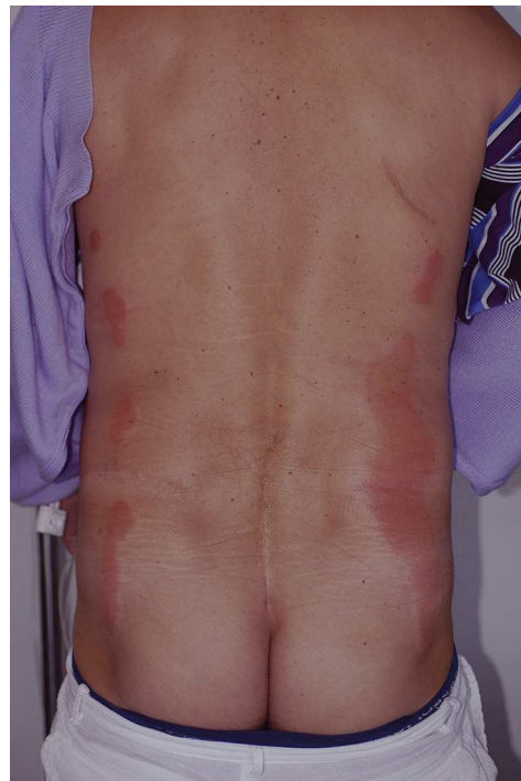
Figura 6 Lesiones paralelas en la zona lumbar tras la aplicación de povidona yodada como antiséptico en una intervención de colectomía.

Debido a que la mayor parte de las intervenciones se realizan en decúbito supino, las lesiones suelen predominar en la espalda, especialmente en la zona sacra 18 . Dentro del diagnóstico diferencial de lesiones inflamatorias posquirúrgicas en esta zona se debe considerar tanto la dermatitis