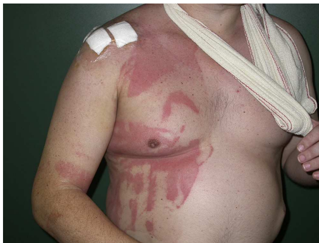
Figura 3 Imágenes abigarradas en un paciente al que se le cubrió el campo quirúrgico con un plástico oclusivo y se le operó en semisedestación.