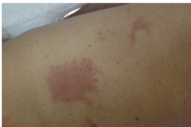
Figura 2 Lesión anular y rectangular, que corresponden a los terminales del control electrocardiográfico y a la toma de tierra del bisturí eléctrico.