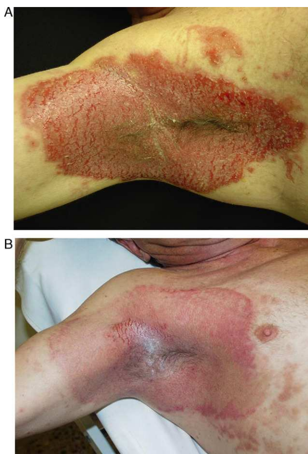
Figura 1 Paciente de 56 años con intensa afectación por enfermedad de Hailey-Hailey en ambas axilas. A. Imagen del paciente un mes después del procedimiento. B. Nótese la gran mejoría de las lesiones y la pequeña zona de recidiva en el hueco axilar. El paciente desestimó hacer una nueva sesión parcial de láser en esa pequeña área.

Los resultados obtenidos en nuestro estudio se muestran en la tabla 1. Casi todos los pacientes experimentaron gran mejoría en las lesiones. Una paciente pocos días después del tratamiento desarrolló lesiones de EHH en el borde entre la piel tratada y la no tratada. A los 6 meses del tratamiento se observaron recidivas focales en un 38% de los pacientes (fig. 1), que fueron posteriormente tratadas con una nueva sesión de láser con un mayor número de pases y con buena evolución posterior. Los pacientes que obtuvieron peores resultados fueron los que se trataron al inicio y recibieron potencias más bajas que pudieron ser insuficientes.