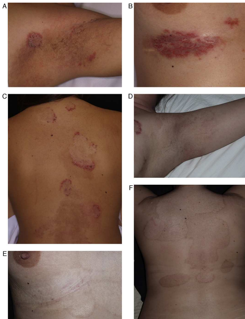
Figura 4 Paciente de 29 años afecta de enfermedad de Hailey-Hailey. A. Presentaba lesiones en la región axilar. B. Lesiones en la región submamaria. C. Lesiones en la superficie posterior del tronco. D, E y F. Imagen de las lesiones 9 meses después de realizar el tratamiento. Nótese la gran mejoría de las lesiones y las zonas de hipo/hiperpigmentación residual que ha dejado la abrasión. A pesar de los cambios de coloración, la paciente decidió realizar una nueva sesión de tratamiento en otras localizaciones.

como terapéuticas (eliminación de hamartomas cutáneos, etc.).