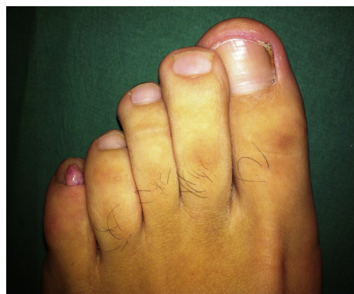
Figura 1 Fibroqueratoma acral en el quinto dedo del pie izquierdo.

La intervención se realizó bajo anestesia local con mepivacaína al 2%, usando como método vasoconstrictor un