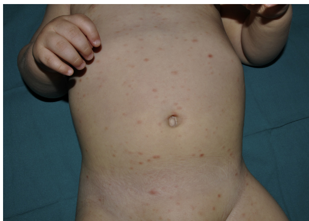
Figura 1 Lesiones eritematosas y descamativas distribuidas en tronco y zona proximal de las extremidades.

La PL es una enfermedad inflamatoria de origen desconocido. En algunos estudios se ha detectado clonalidad para células T, lo cual indica bien una respuesta inmunitaria a un agente infeccioso todavía no identificado, o bien que la PL es un proceso linfoproliferativo cutáneo de células T 1 . Sin