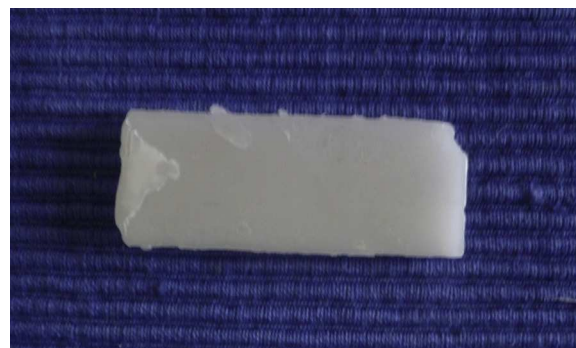
Figura 1 Cera para huesos (formato original).

En nuestros pacientes hemos empleado la cera para huesos. Se trata de una mezcla compuesta por cera de abejas, palmitato de isopropilo y un agente estabilizador. Su uso original fue para la hemostasia debido al efecto de taponamiento puramente mecánico que ejerce en los canales abiertos sangrantes. Es un material biológicamente inerte que no ocasiona alergia cutánea ni dermatitis irritativa. No se absorbe y permanece en la herida sin adherirse a ella. Esta pobre adhesión hace que la retirada sea fácil e indolora. Además, tiene la gran ventaja de que es un material maleable. Su formato original es una lámina rectangular fina (fig. 1), pero con el calor de las manos se moldea para que cubra perfectamente las curvaturas del defecto quirúrgico (fig. 2). Esta cualidad es especialmente ventajosa en localizaciones como la oreja, nariz o el canto