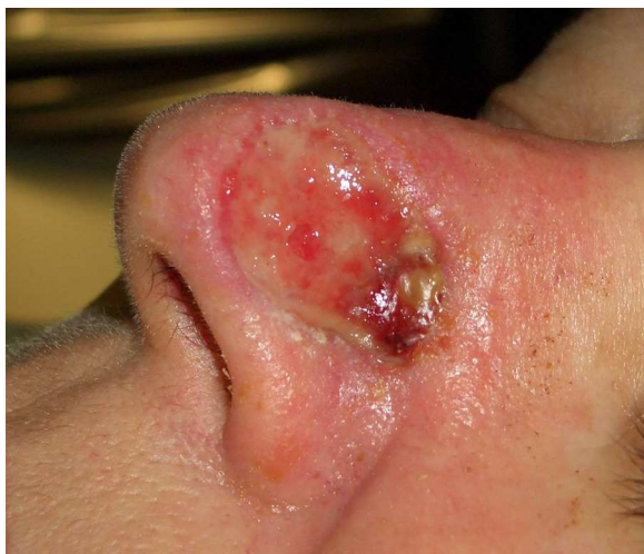
Figura 8 Aspecto de la herida una semana después de aplicar cera para huesos.

presencia de patologías como diabetes mellitus, coagulopatías, tabaquismo o alcoholismo no favorecen la cicatrización por segunda intención y aumenta el riesgo de infección o necrosis 3 .