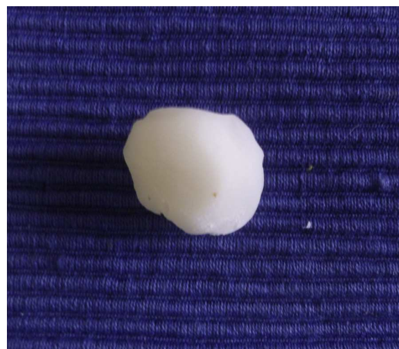
Figura 2 Cera para huesos moldeada.

Paciente 2: mujer de 64 años con un carcinoma basocelular infiltrante en la cara lateral izquierda de la nariz, a quien se realizó una cirugía de Mohs que resultó en un profundo