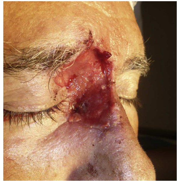
Figura 5 Aspecto de la herida una semana después.

defecto quirúrgico, con exposición del cartílago (fig. 6). Se aplicó cera para huesos que cubría perfectamente toda la profundidad del defecto (fig. 7), y al cabo de una semana se retiró observándose una excelente regeneración de la herida (fig. 8).