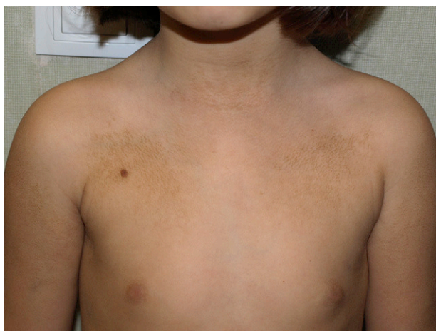
Figura 1 Aspecto clínico de las lesiones.