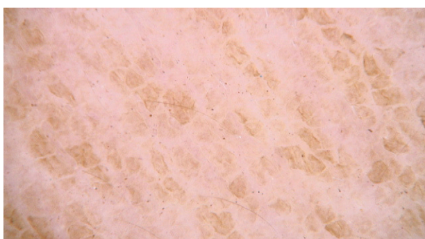
Figura 2 Microscopia de epiluminiscencia realizada con dermatoscopia digital de contacto empleando líquido de inmersión.

anterior del tronco, los hombros y la base del cuello (fig. 1). Con la dermatoscopia se apreció ausencia de patrón melanocítico o alteraciones vasculares y zonas de pigmentación marrónácea de morfología poligonal, en ocasiones de disposición lineal, que respetaban los pliegues naturales de la piel (fig. 2).