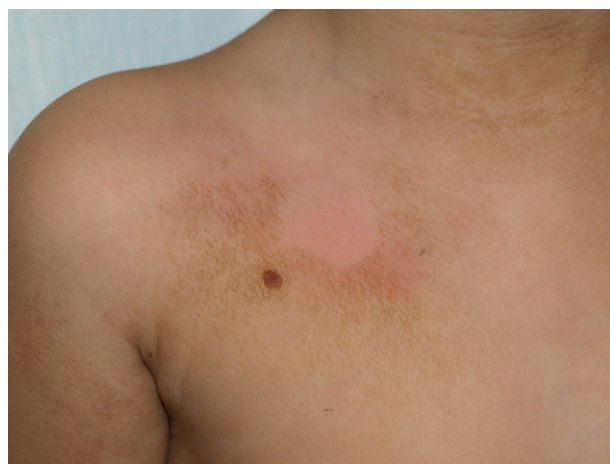
Figura 3 Aspecto clínico de las lesiones tras fricción con una torunda de algodón embebida en alcohol etílico al 70%.