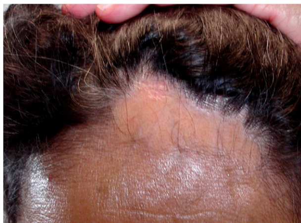
Figura 1 Mujer de 51 años con una placa de alopecia en banda en región fronto-temporal. Nótese la recesión de la línea de implantación del pelo.

Desde su descripción en 1994, se han comunicado poco menos de 200 casos de AFF en la literatura mundial 1,2,4 . Aunque inicialmente se consideraba como una entidad poco frecuente, actualmente se cree que esta causa de alopecia cicatrizal es más común de lo que se pensaba 2 . Existen escasas publicaciones que documenten los hallazgos dermatoscópicos en pacientes con alopecia frontal fibrosante. Varios de estos hallazgos dermatoscópicos son característicos de la AFF mientras que otros aparecen también en otros tipos de alopecia cicatrizal, como el lupus eritematoso discoide (LED) o liquen plano pilar (LPP). Inui et al 6 describieron tres hallazgos dermatoscópicos en cuatro pacientes con AFF: pérdida del ostium folicular, eritema y escama perifolicular también descritos en el caso que presentamos. Otros hallazgos dermatoscópicos como capilares