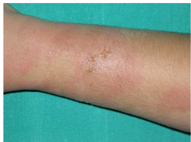
Figura 2 Limpiadora de pescado que presentó una dermatitis aguda a las 24 horas de reincorporarse a su trabajo tras una baja laboral.

En nuestra experiencia las proteínas de pescados son las responsables más frecuentes de DCP en nuestro medio. Las proteínas del látex de los guantes de goma deben incluirse como un agente etiológico también importante, aunque la hipersensibilidad inmediata al látex suele manifestarse con