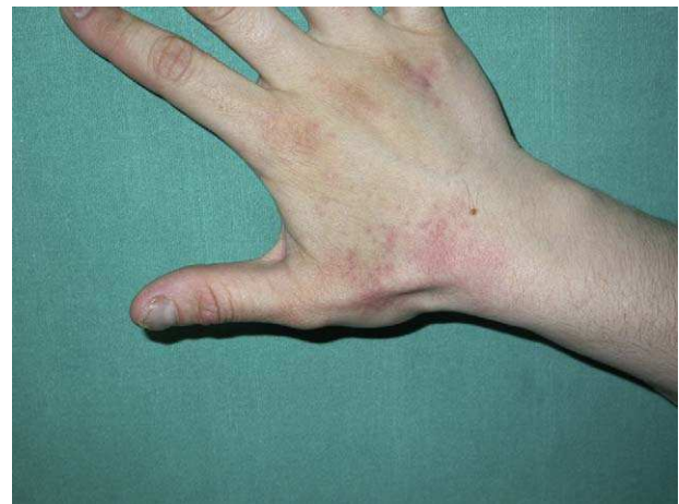
Figura 1 Dermatitis subaguda típicamente localizada en el dorso de las manos.

RD: relevancia desconocida; RP: relevancia presente; RPa: relevancia pasada; SOA: síndrome oral de alergia.