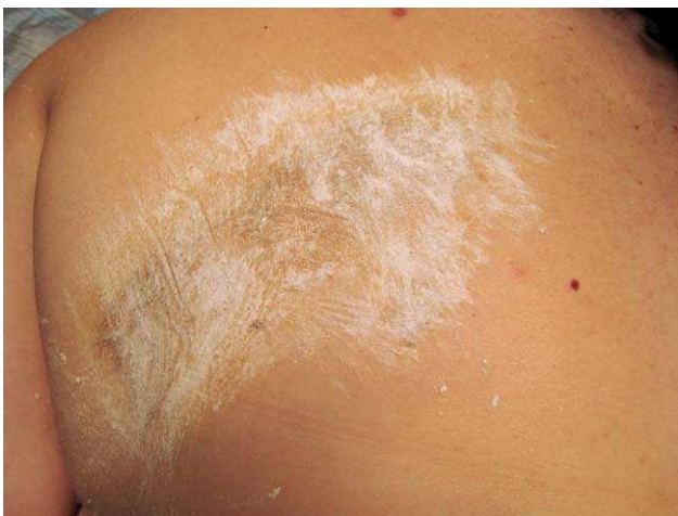
Figura 5 Prueba del yodo-almidón. Tinción negruzca tenue del almidón en la zona de la lesión.

Desde el punto de vista histológico se caracteriza por hiperplasia de glándulas ecrinas normales o dilatadas en próxima asociación con focos de capilares angiomasos y presencia variable de estructuras pilares, lipomatosas, mucinosas y linfáticas 1,5,6,10 . La porción angiomaso está compuesta de capilares de pared fina y vasos de paredes gruesas dilatados en un estroma fibrocolagenoso denso entre las glándulas ecrinas 6 . El que puedan aparecer folículos pilosos, mucina, estructuras linfáticas, e incluso glándulas apocrinas, tejido adiposo o colágeno denso en el estroma le confiere la naturaleza hamartomatosa 2,5,8 . No hay mitosis ni presencia de atipia 8,12 . Las lesiones se localizan en la dermis profunda y en el tejido celular subcutáneo 9 . La epidermis no suele presentar anomalías 6 , aunque en algunos pacientes se han descrito hiperqueratosis, papilomatosis o acantosis 3 .