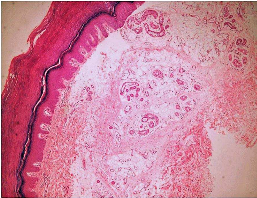
Figura 4 Imagen de la biopsia del caso 2. Proliferación hamartomatosa de glándulas ecrinas, capilares, tejido adiposo y colágeno desestructurado (H-E, x40).

El hamartoma angiomaso ecrino suele ser asintomático, aunque puede haber dolor o hiperhidrosis asociados 1,2,5,13 . El dolor se presenta en aproximadamente la mitad de los casos, con mayor intensidad inicialmente y disminuyendo tras años de evolución 5 . Este síntoma puede explicarse por la presencia de pequeños nervios que infiltran las lesiones 1,2,6,12,13 . Según algunos autores, el dolor y también un rápido crecimiento de la lesión podrían estar influenciados por hormonas, de ahí la exacerbación durante la pubertad y el embarazo en algunos casos 1,2,8,13 . La hiperhidrosis es una manifestación del componente ecrino que está presente en un tercio de los casos; se desencadena por estímulos habituales de la secreción ecrina como calor o estrés, aunque también puede ocurrir tras la manipulación de la lesión o espontáneamente 1,2 . Se piensa que la elevada