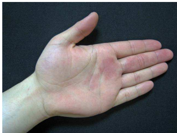
Figura 2 Lesión en mano en el paciente del caso 2.

El origen del hamartoma angiomaso ecrino puede explicarse por alteraciones bioquímicas en las interacciones entre el epitelio diferenciado y el mesénquima subyacente 1,3,5,6-8 . Se ha descrito asociación con radioterapia, y en casos de presentación tardía se ha propuesto relación con traumatismos repetidos 9,10 .