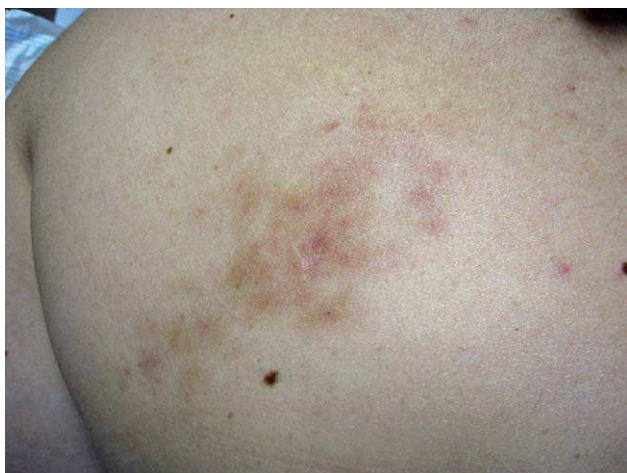
Figura 1 Lesión en espalda en la paciente del caso 1.

El término de hamartoma angiomaso ecrino fue acuñado por Hyman et al en 1968, pero probablemente esta lesión fue primeramente descrita por Lotbeck en 1959 1-5 .