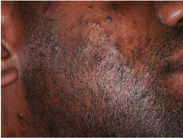
Figura 5 Pseudofoliculitis de intensidad moderada en un paciente de raza negra.