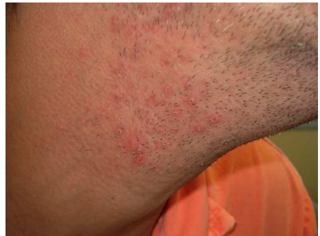
Figura 3 Pseudofoliculitis de intensidad leve en un paciente de raza blanca.

También ocurre en ciertos trabajos en los que los sujetos tienen que apoyar un aparato o una superficie dura contra la mejilla durante largos períodos de tiempo. Un caso clásico es el «cuello de violinista», una pseudofoliculitis de la barba causada por la presión del violín bajo el cuello 25,26 . Otros tipos de pseudofoliculitis ocupacional se presentan en personas que utilizan objetos, aparatos o ropas constrictivos que rozan sobre zonas pilosas y producen una depilación por fricción.