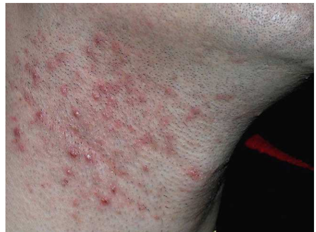
Figura 4 Pseudofoliculitis de intensidad leve-moderada en un paciente de raza blanca.