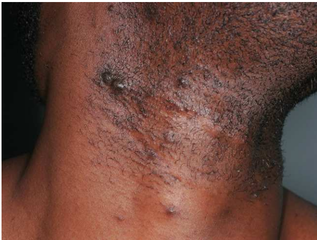
Figura 6 Pseudofoliculitis de intensidad moderada con lesiones hiperpigmentadas en un paciente de raza negra.

También se han descrito casos relacionados con la toma de medicamentos que pueden favorecer el acné como los corticoides y la ciclosporina 27,28 .