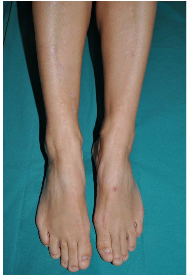
Figura 2 Epidermolisis ampollosa distrófica dominante. Afectación preferentemente ungueal y pequeñas cicatrices distróficas blanquecinas en ambas regiones pretibiales.

El papel de la enfermería en la realización de las curas y el seguimiento de las lesiones cutáneas es esencial, y por tanto la formación y la experiencia de este colectivo son de gran utilidad. Lamentablemente, nuestro sistema sanitario apenas contempla la especialización de la enfermería, por lo que habitualmente contamos más con la buena voluntad de estos profesionales que con auténticos programas específicos de formación. La enfermería se encarga de educar a las familias en el manejo de los niños, les aconseja acerca de los apósitos y tratamientos tópicos idóneos y, en general,