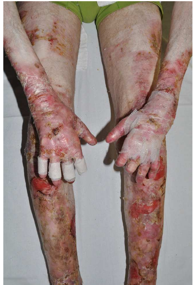
Figura 3 Graves cicatrices distóricas en las cuatro extremidades y pérdida de la parte distal de los dedos en un paciente con una forma grave de epidermólisis ampollosa distrófica recesiva.

Las contracturas musculares son otra complicación frecuente, en ocasiones muy invalidante. Pueden afectar a cualquier