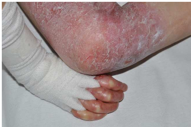
Figura 4 Separación proximal de los dedos de las manos por medio de vendas de algodón para prevenir la fusión proximal de los dedos ( webbing ).

dilatada, cuya etiología es multifactorial, incluyendo la sobrecarga de hierro exógeno, la deficiencia de micronutrientes (sobre todo carnitina 42 y selenio 43 ), la anemia crónica 44 , el empleo de medicaciones cardiotoxicas como amitriptilina y cisaprida 45 , e incluso las posibles infecciones virales intercurrentes 46 . Puede comenzar en la primera década de la vida y es más frecuente en los pacientes con insuficiencia renal crónica. El 30% de los casos de EADR grave a los que se les detectó una cardiopatía murieron a consecuencia de la misma 41 . El diagnóstico precoz de la cardiopatía es esencial para poder modificar todos los factores agravantes comentados.