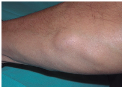
Tumor subcutáneo en antebrazo, bien delimitado, de consistencia firme, no adherido a estructuras profundas, doloroso a la palpación.