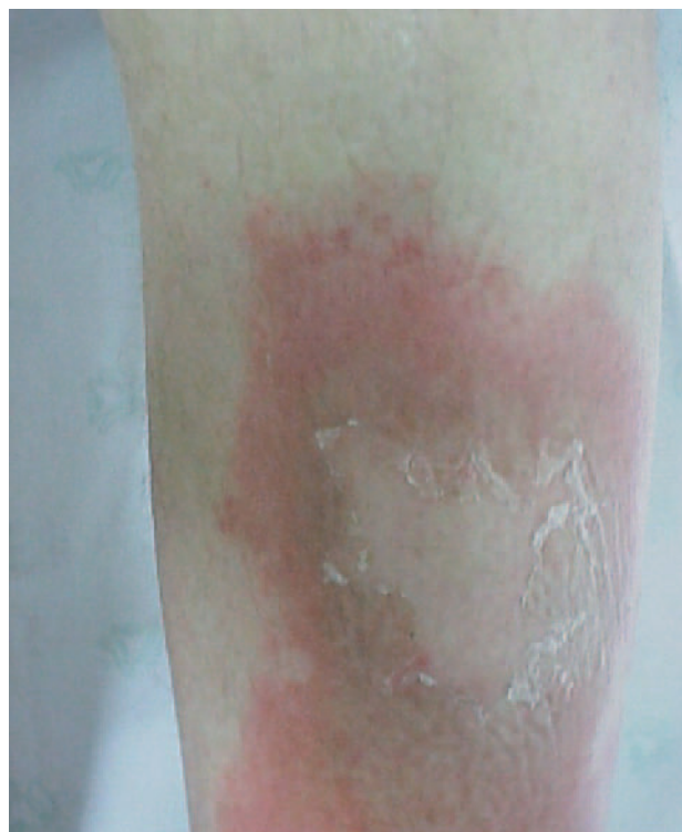
Fig. 1.—Lesiones con centro curativo, descamación periférica y eritema circundante.

descamación en láminas localizadas en cara anterior de ambos miembros inferiores, tronco y cuello (fig. 1). Además presentaba discretas lesiones de rascado y glosopirosis. La paciente mostraba un deficiente estado de nutrición.