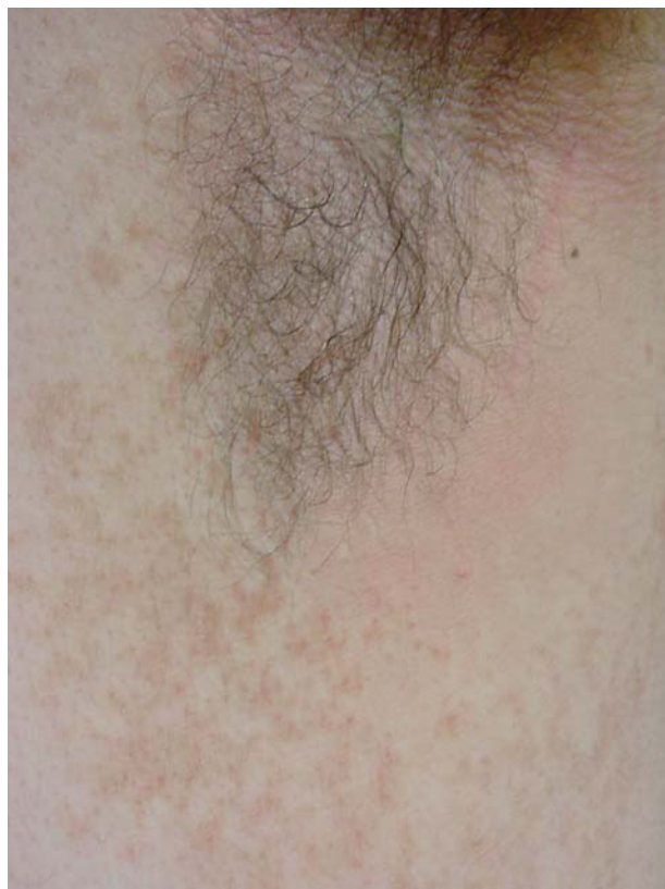
Fig. 2.—Pápulas marrones en lateral de tronco y axilas.

intermamaria e interescapular, aunque a veces, como en el caso expuesto, las lesiones se inician en el abdomen. A medida que progresa la enfermedad, las pápulas se pigmentan, se hacen verrugosas, aumentan de tamaño (en torno a 4-5 mm), tienden a confluir en el centro del abdomen y originan imágenes reticuladas en el borde. Las lesiones se extienden lentamente durante años, de modo que pueden afectar completamente al tronco, los brazos, el cuello y las axilas. La enfermedad evoluciona de forma crónica y puede empeorar en verano, aunque la regresión espontánea también es posible 2 .