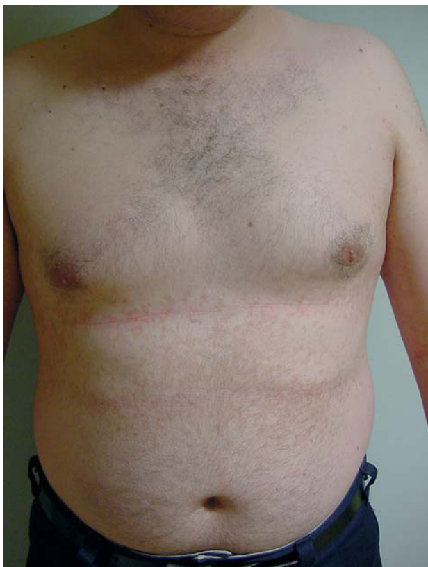
Fig. 1.—Pápulas de color marrón claro en abdomen que confluyen a nivel de la línea media y forman un patrón reticulado en la periferia.