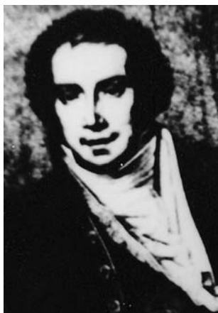
Fig. 1.—Jean Louis Marc Alibert (1768-1837).