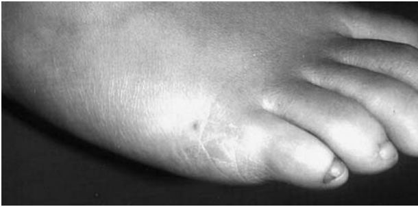
FIG. 2.—Lesiones eritemato-descamativas en cara lateral del pie desbordando hacia el dorso.

extendían hasta la cara lateral de los dedos, adoptando un aspecto eritematoso y descamativo (fig. 2).