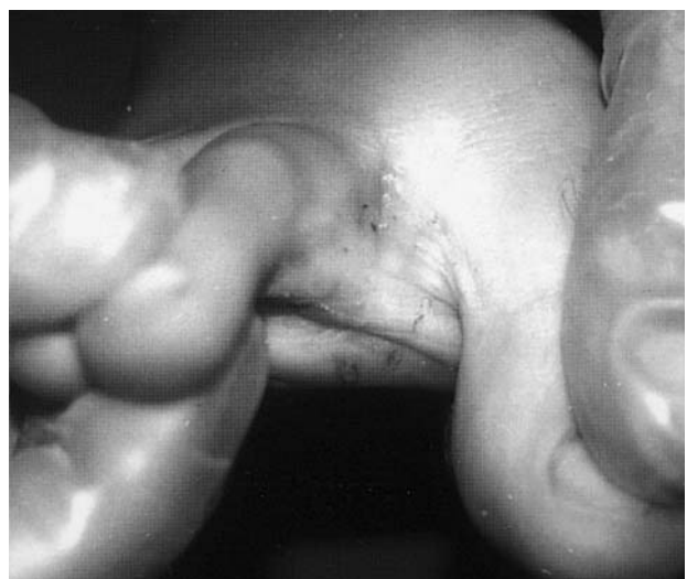
FIG. 1.—Primer espacio interdigital, con discreta descamación y maceración.

En la exploración se observaba maceración de coloración blanquecino-grisácea, con fisuras y eritema en los espacios interdigitales de ambos pies, principalmente en el tercero y cuarto (fig. 1). Las lesiones se