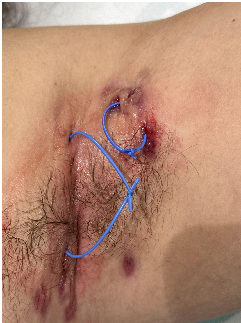
Figura 1 Setones colocados en dos fístulas axilares.

Nuestro estudio no está exento de limitaciones. Una limitación es el tamaño de la muestra, que puede condicionar la falta de diferencias estadísticamente significativas en la reducción de la escala DLQI antes y después de la colocación de setones. Otra de las limitaciones es el corto tiempo de seguimiento (4-6 semanas), lo que impide conocer si se presentan recaídas más tardías.