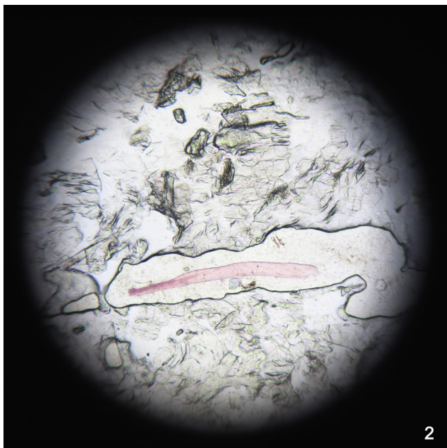
Figura 2 Test de celo bajo visión directa en microscopio óptico donde se observan estructuras fibrilares rosadas (x40).