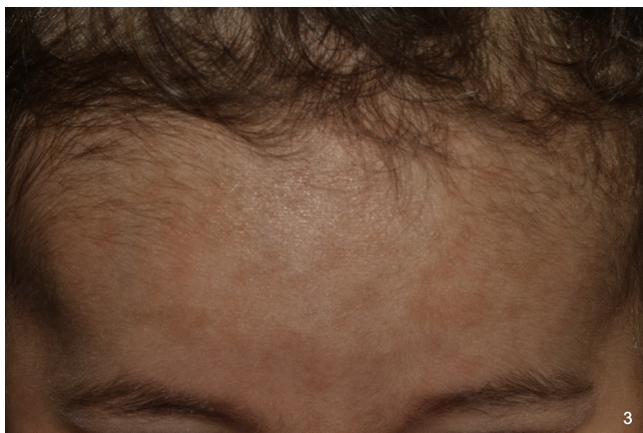
Figura 3 Máculas hiperpigmentadas en región frontotemporal en niña de origen sudamericano de un año.

Durante la valoración inicial de un paciente con máculas hiperpigmentadas es fundamental incluir dentro del diagnóstico diferencial un amplio grupo de entidades de etiopatogenia e implicaciones pronósticas muy diversas (tabla 1). La pigmentación postinflamatoria es la causa más frecuente de hiperpigmentación adquirida y transitoria en los niños. La pitiriasis versicolor se manifiesta como máculas hipo- o hiperpigmentadas con descamación furfu-