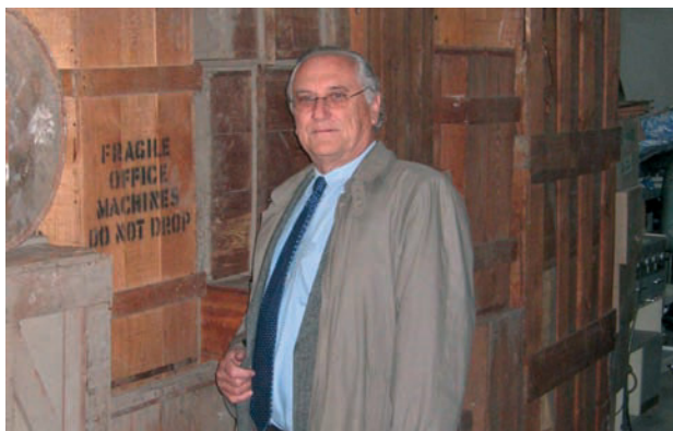
Almacén del Hospital del Niño Jesús donde se encontraron las cajas el 27 de diciembre de 2005.