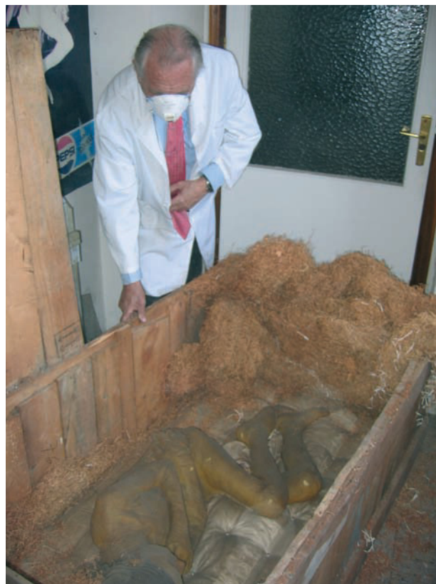
Apertura del cajón donde se encontraba la «Mujer Herpética».