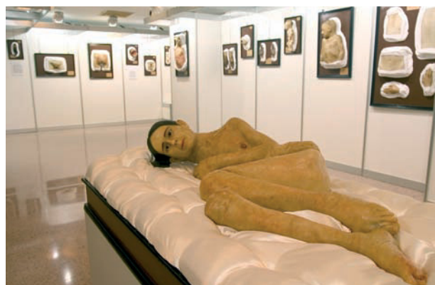
Vista general de la exposición de figuras recuperadas durante el XXXIV Congreso Nacional de Dermatología celebrado en Madrid del 24-27 de mayo de 2006.

En 2006, durante el XXXIV Congreso Nacional de la AEDV (Madrid, 24-27 de mayo) se realizó una exposición de las 40 figuras más características que habían sido recuperadas y restauradas hasta la fecha. Esta exposición constituyó todo un éxito y sirvió para que todos los dermatólogos españoles conocieran el proyecto de recuperación de este tesoro de nuestra Dermatología (fig. 3).